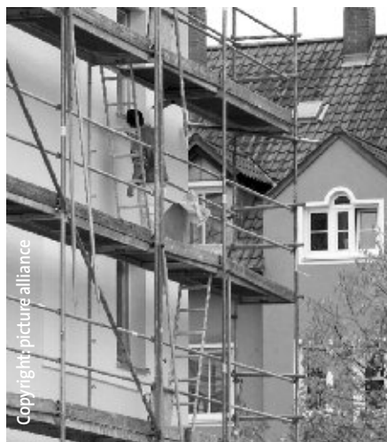
Unser Ziel: Preiswertes Wohnen durch das Stuttgarter Innenentwicklungs-Modell.

Da lohnt sich der Blick nach München. Wo auch immer in München neues Baurecht geschaffen wird, da muss der Investor 30% seines Grund und Bodens zu einem verbilligten Preis zur Verfügung stellen, und dort müssen Sozialwohnungen oder andere preisgünstige Wohnungen gebaut werden. Neues Baurecht führt fast immer zu hohen Bodenwertsteigerungen. So ist es fair, wenn ein Teil